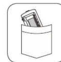
Light and handheld